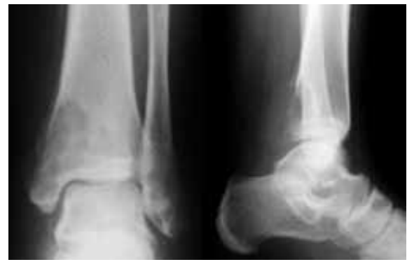
Figure 2 : Radiographie de la cheville (2 mois après): Effraction de la corticale postérieure et envahissement des parties molles avec apparition d'une réaction périostée en «triangle de Codmann»

L'IRM a souligné la présence d'une lésion épiphysio-métaphysaire multiloculaire, se rehaussant après injection de gadolinium et refoulant les parties molles postérieures sans atteinte articulaire. Le pédicule vasculo-nerveux tibial postérieur était refoulé sans être envahi par la tumeur (Fig 3). Cet aspect était compatible avec un processus pathologique très rapidement évolutif et hautement agressif évoquant en premier lieu une tumeur osseuse maligne.