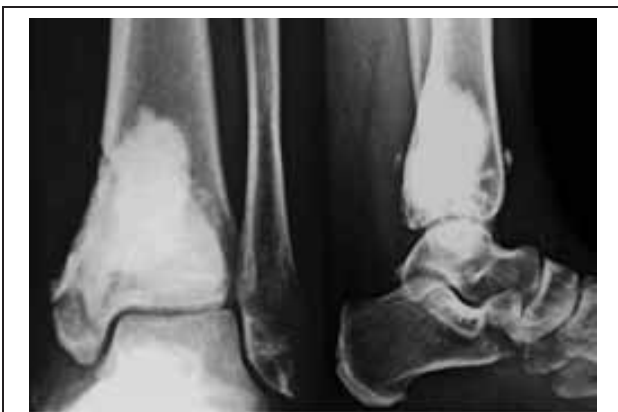
Figure 6 : Résultat radiologique satisfaisant au recul de 30 mois : sclérose (flèche) entourant le ciment et absence d'ostéolyse