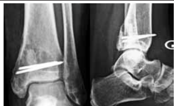
Figure 4 : Radiographie standard 11 mois après le premier curetage objectivant une ostéolyse du pilon tibial témoignant d'une récurrence tumorale

L'évolution a été marquée par la survenue d'une récurrence tumorale au terme de 11 mois, suspectée par la réapparition de la tuméfaction et de l'ostéolyse (Fig 4), confirmée par l'examen anatomopathologique de la biopsie.