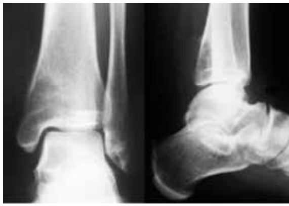
Figure 1 : Radiographie de la cheville : Ostéolyse géographique excentrée au niveau de la partie postéro-interne de l'extrémité inférieure du tibia gauche

La radiographie standard pratiquée, ailleurs, 2 mois avant, a montré la présence d'une ostéolyse géographique excentrée localisée au niveau de la partie postéro-interne de l'extrémité inférieure du tibia gauche type Ib de Lodwic, passée inaperçue (Fig 1).